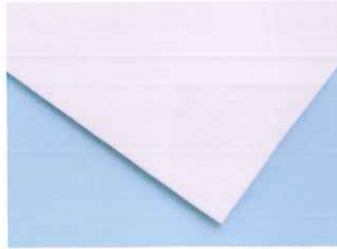
天然カラーゴムシート W-120