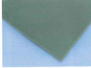
天然カラーゴムシート G-140