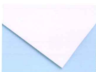
天然カラーゴムシート W-120