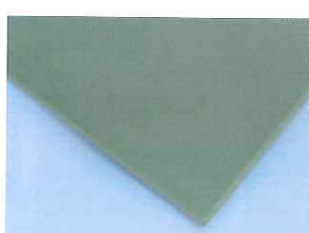
天然カラーゴムシート G-140